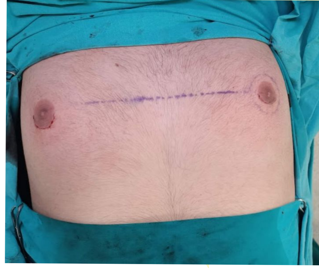
Resim 2. Postoperatif görüntü