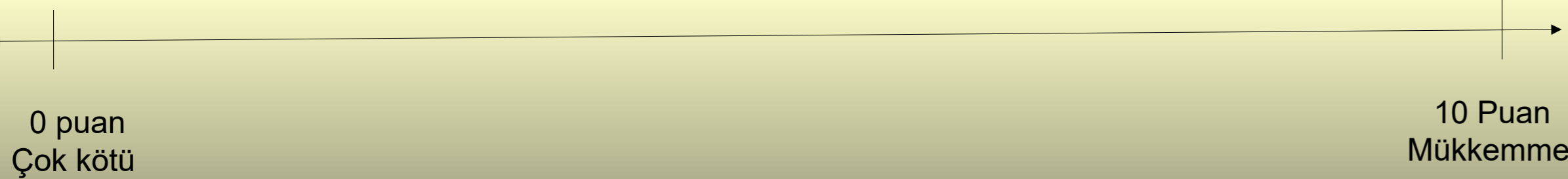
Tablo 2. Preoperatif ve Postoperatif memnuniyet skalası