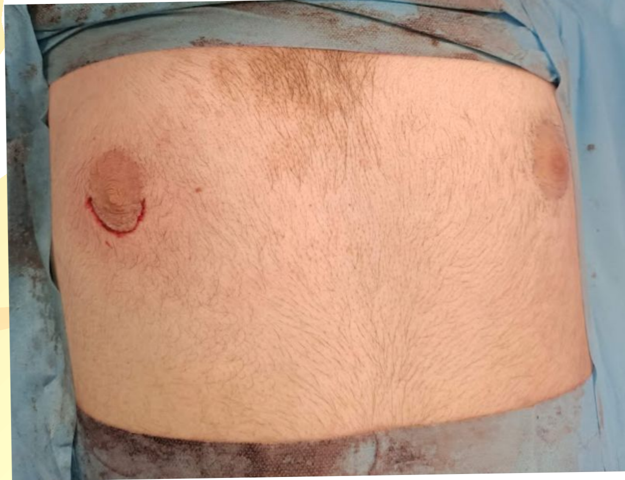
Resim 2. Postoperatif görüntü