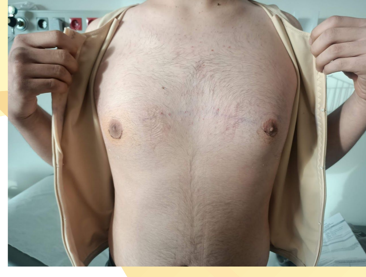
Resim 3. Postoperatif 1 ay sonraki görüntü