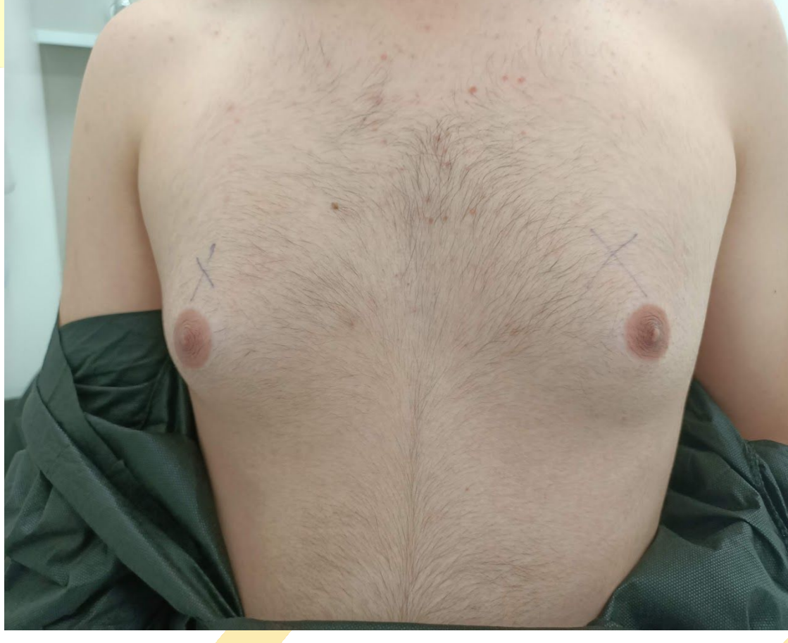
Resim 1. Preoperatif görüntü

Sonuç: Jinekomastinin subareolar insizyonla cerrahisi, adolesan dönemde belirgin estetik ve psikolojik düzelme sağlamaktadır. Adolesan dönemde meydana gelen akran baskısının ve bunun erişkinlik dönemine olası yansımaları önlemek için bu dönemde cerrahi tedavinin ertelenmemesi önerilmektedir. Hastaların operasyon sonrası meme başı çöküntüsünün minimize edilmesi ve iyi bir estetik sonuç için cilt elastisitesi oldukça önem arz etmektedir. Bu nedenle hastaların preoperatif ve postoperatif göğüs kaslarını çalıştırıcı egzersizler yapmaları önerilmektedir.