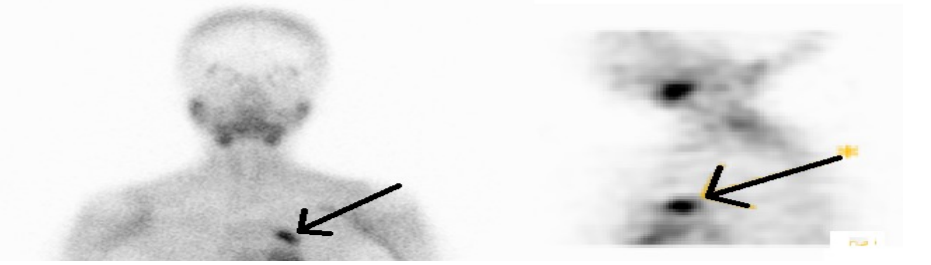
Şekil 1: Sintigrafide torasik ektopik paratiroid adenomu